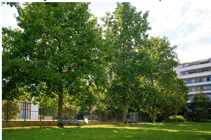
Tulipiers de Virginie.