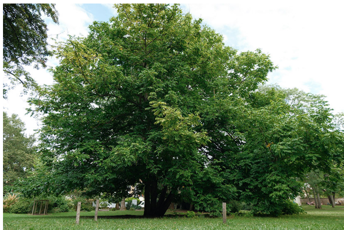
Ptérocaryer du Caucase.