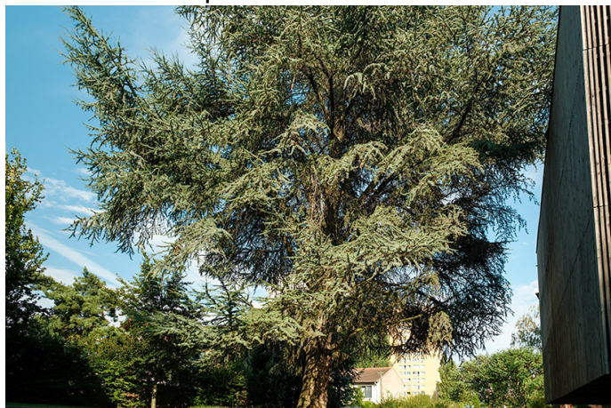
Métaséquoia du Sechuan. Crédit photo : Yaniss Hammad