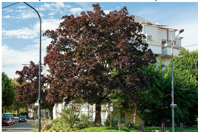
Hêtre pourpre.