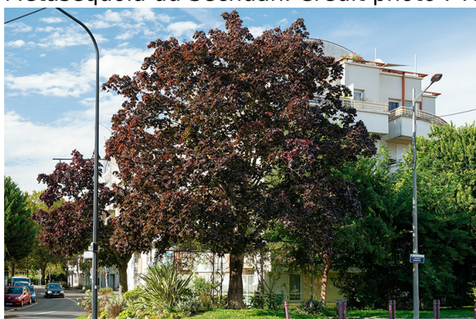
Hêtre pourpre.