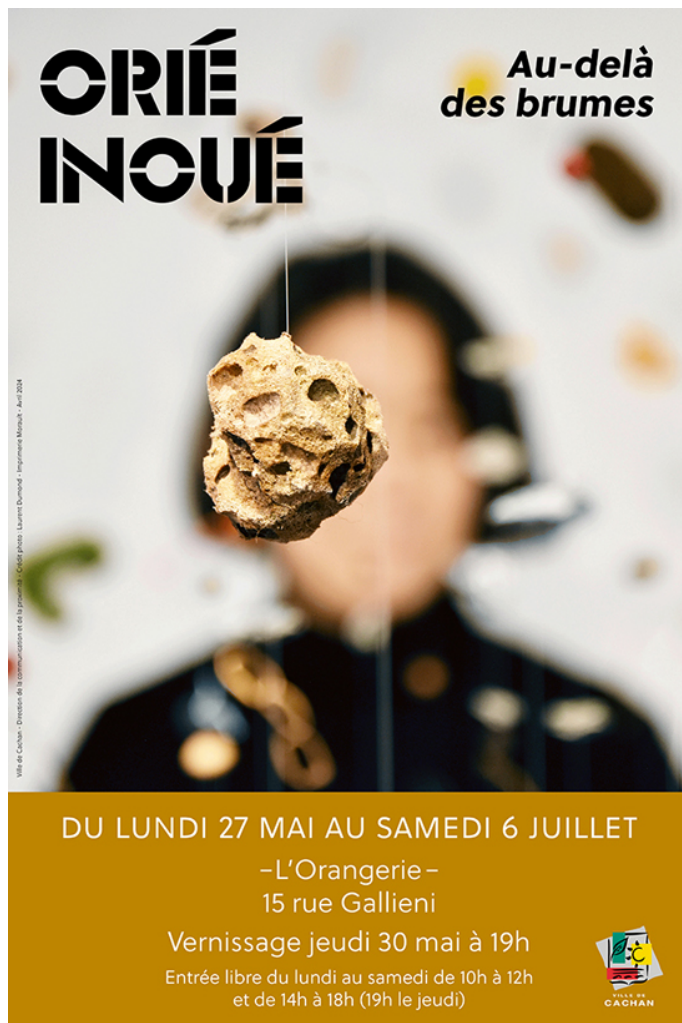
Affiche de l'exposition.

Dans cette exposition particulièrement, Orié Inoué s'interroge sur le passage du temps et le cycle perpétuel de la vie, tout en questionnant la relation problématique entre l'Homme et la nature. Une difficulté de connexion de l'humain au monde naturel qu'elle symbolise ici par l'évocation d'une sorte de langage caché et énigmatique de la nature, existant depuis la nuit des temps et avec lequel les humains étaient peut-être autrefois connectés, mais dont nous aurions aujourd'hui perdu les clés nous permettant de le décrypter.