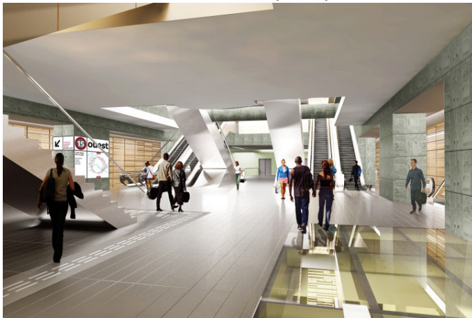
Gare d'Arcueil-Cachan : perspective sur la mezzanine.