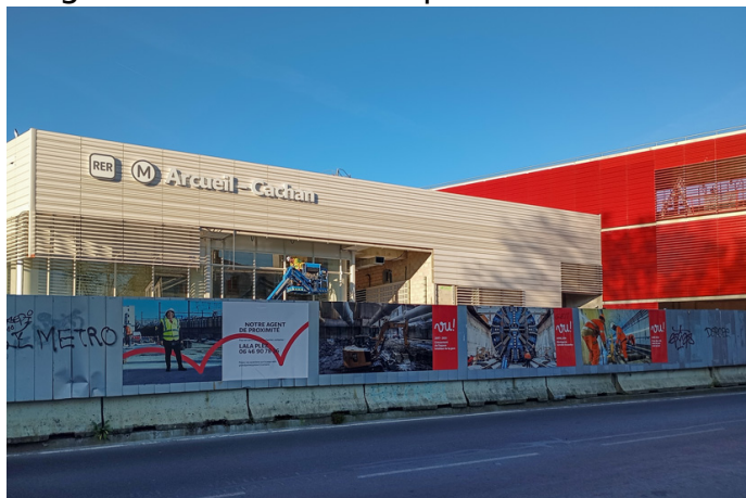
Façade de la gare Arcueil-Cachan (2025).