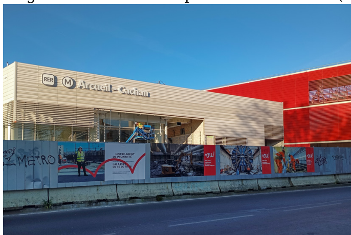
Façade de la gare Arcueil-Cachan (2025).