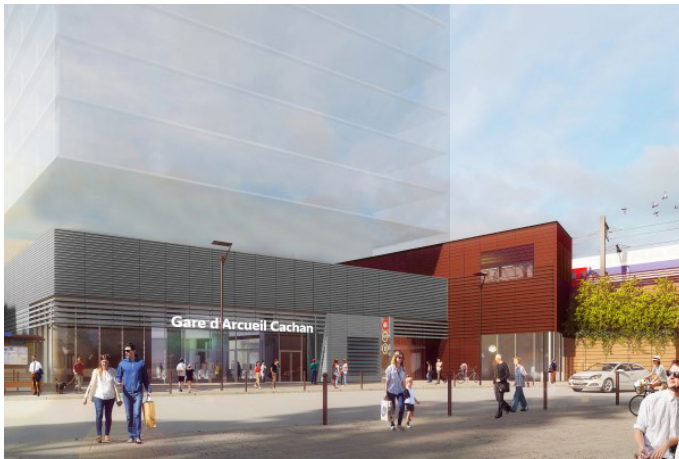
Gare d'Arcueil-Cachan : perspective sur le parvis de la gare.