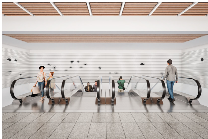
Œuvre du sculpteur Vincent Mauger