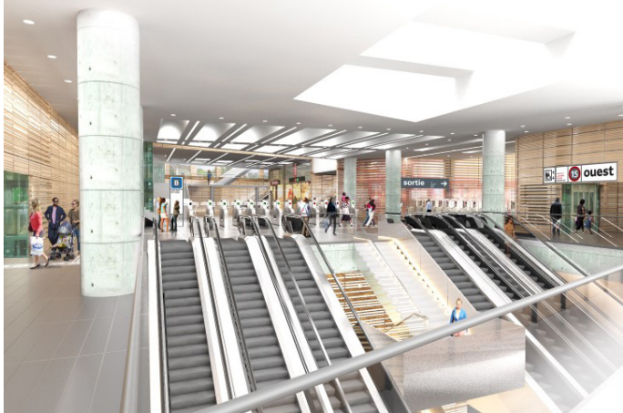
Gare d'Arcueil-Cachan : perspective sur le rez-de-chaussée.