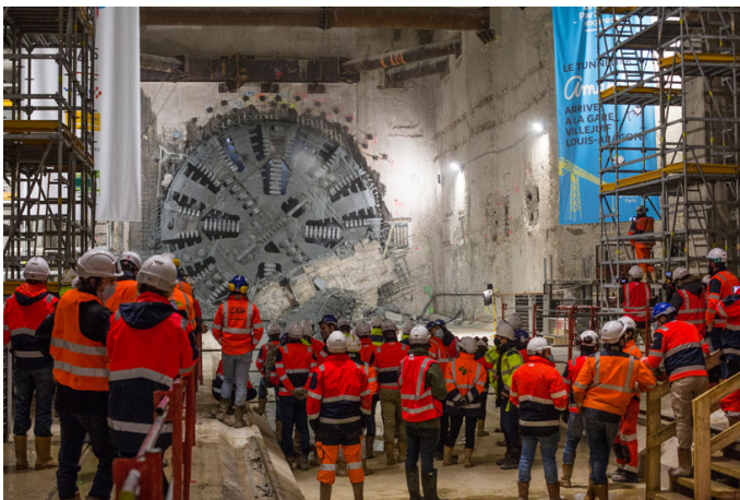
L'arrivée du tunnelier Amandine à Cachan (2020).