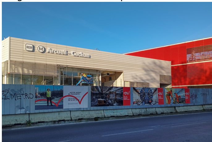
Façade de la gare Arcueil-Cachan (2025).