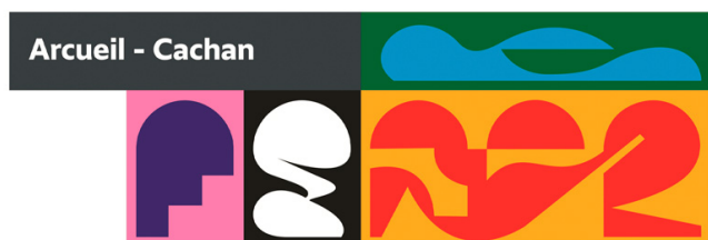
Life under the Arches, fresque de Felix Pfäffli