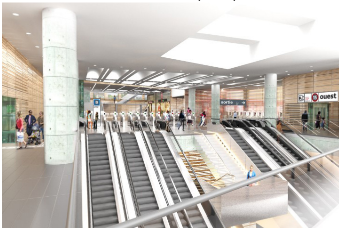
Gare d'Arcueil-Cachan : perspective sur le rez-de-chaussée.