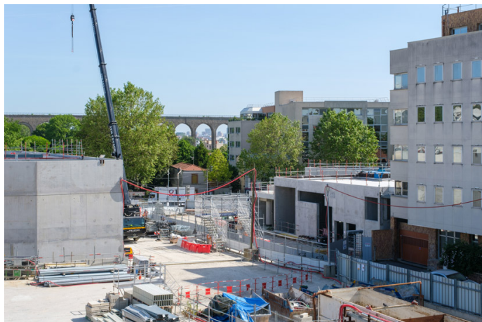
La gare Arcueil-Cachan pendant les travaux (2023).