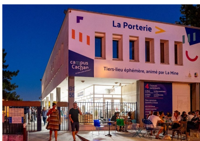
Ouverture du tiers lieu La Porterie en septembre 2023

La concertation se poursuit. Un tiers-lieu éphémère, géré par l'association La Mine, s'est installé dans le bâtiment de la Porterie, à l'entrée du campus, d'août 2023 à fin 2024, pour préfigurer de nouveaux usages.