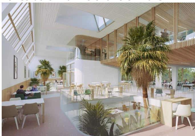
Le restaurant universitaire en 2025