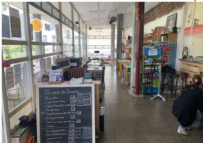
L'espace restauration de La Porterie