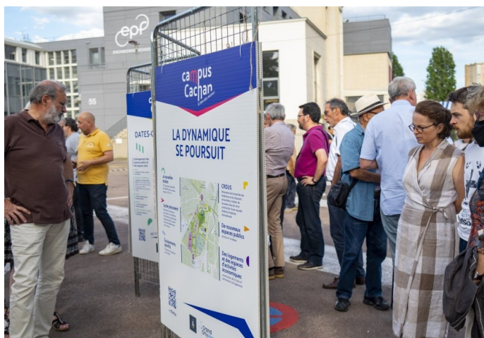
Exposition en 2022