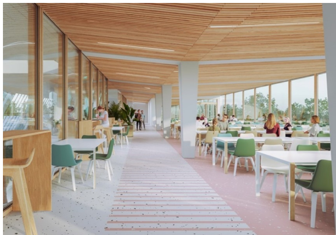
Le restaurant universitaire en 2025