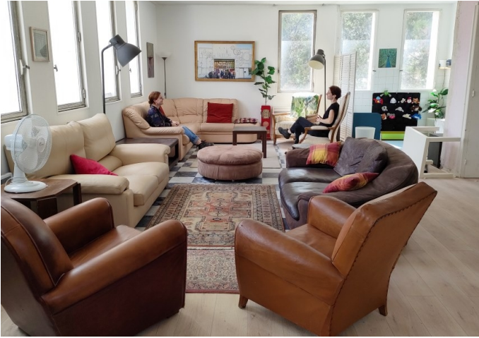
Un espace coworking et réunion