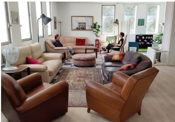
Un espace coworking et réunion