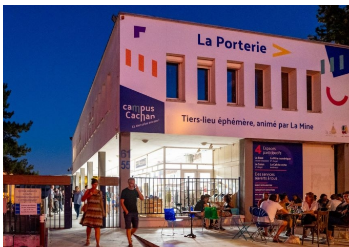
Ouverture du tiers lieu La Porterie en septembre 2023

La concertation se poursuit. Un tiers-lieu éphémère, géré par l'association La Mine, s'est installé dans le bâtiment de la Porterie, à l'entrée du campus, d'août 2023 à fin 2024, pour préfigurer de nouveaux usages.