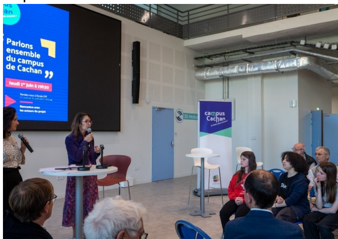
Réunion publique en juin 2023