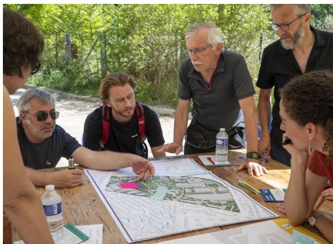
Atelier de concertation en 2022

Une large concertation avec les habitants et les associations locales est mise en œuvre dès 2017 : les grandes lignes du projet d'aménagement sont présentés et des balades, ateliers participatifs, réunions publiques et enquêtes permettent de faire découvrir le site et d'associer les habitants à la définition du projet d'aménagement avant le lancement des études.