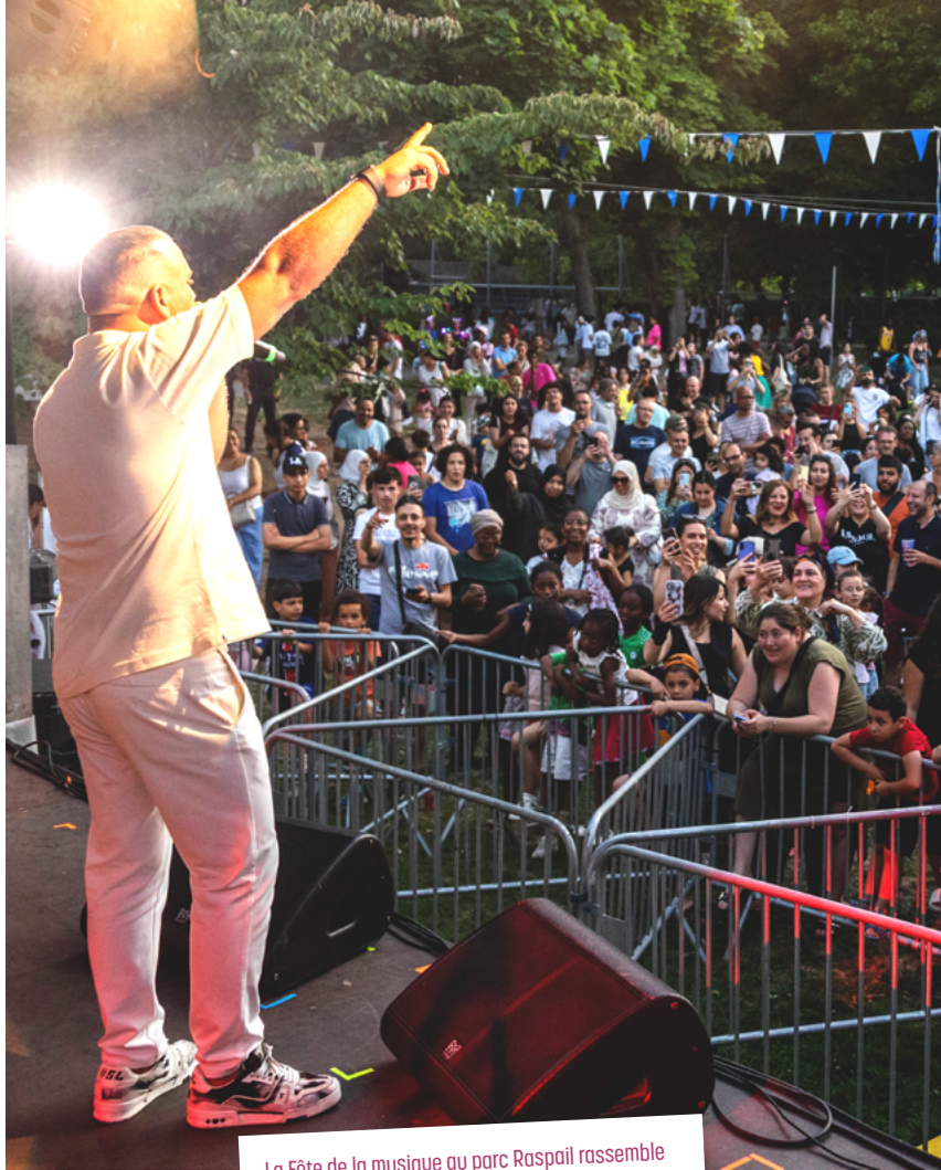
La Fête de la musique au parc Raspail rassemble chaque année tout Cachan

+ d'infos : Concert des chorales le 10 juin, à 19h et le 17 juin, à 20h au théâtre Jacques Carat, le 16 juin à l'espace Jean Vilar (Arcueil), le 24 juin dans la cour du conservatoire à 14h (entrée libre).