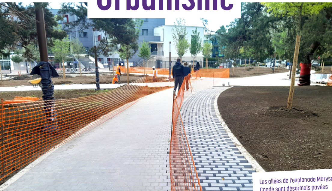
Les allées de l'esplanade Maryse Condé sont désormais pavées

7 500 m 2 d'espaces publics livrés fin mai (esplanade Maryse Condé et rue Anita Conti)