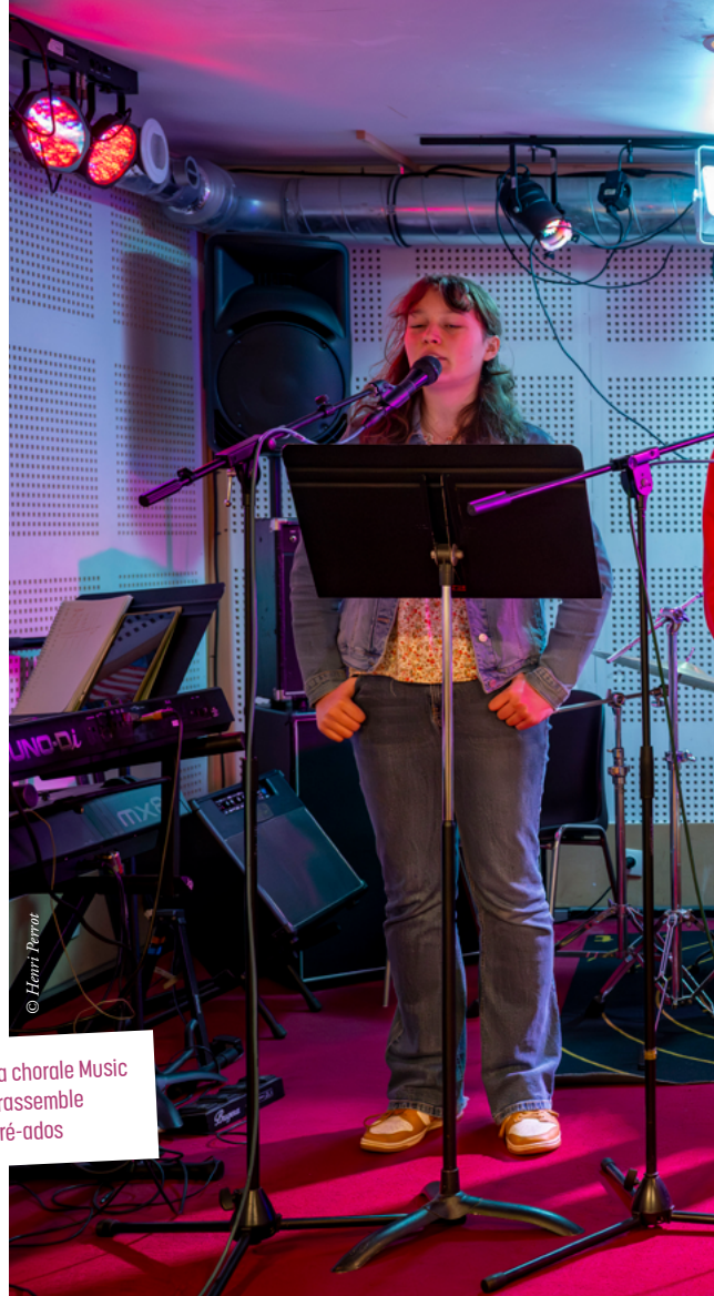
À l'Edim, la chorale Music n'Groove rassemble ados et pré-ados