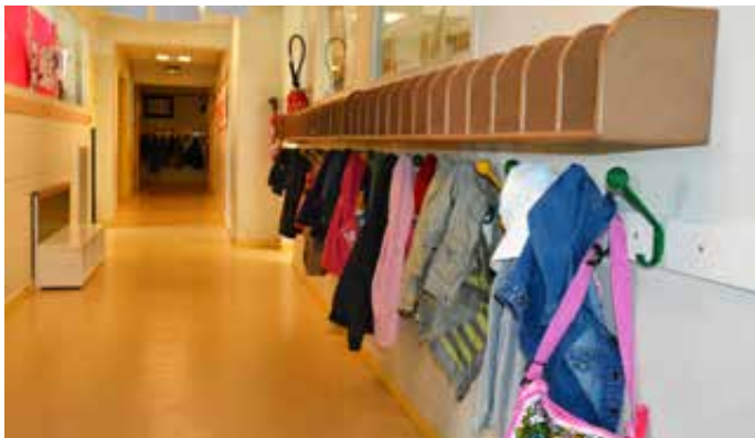
Réfection de casiers – école Belle image.