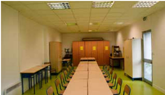
Réfection de la peinture d'une salle de classe – école du Coteau.