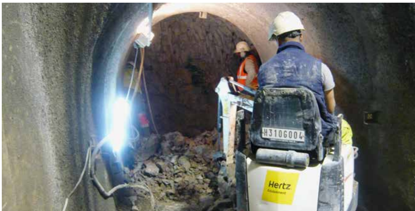
Travaux de terrassement du puit et de la galerie pour la reconnaissance du sous-sol.