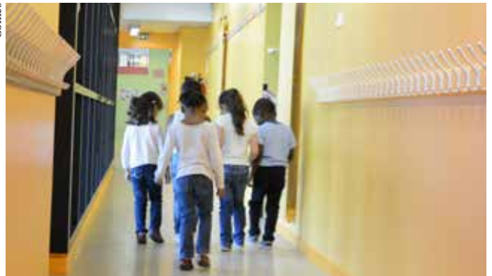
Réfection de la peinture du couloir du rez-de-chaussée – école Belle image.