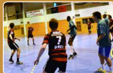
Handball club de Cachan Page 23