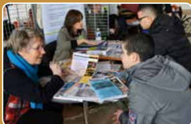
Forum des métiers Page 11