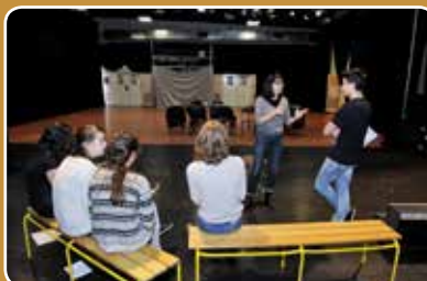
Théâtre et danse Page 20