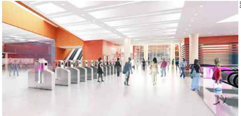
Vue de la salle d'échange (vue de synthèse en cours d'étude – susceptible d'être modifiée)

Symbole fort de la future métropole, ce nouveau réseau de transport long de 200 km sera composé de quatre lignes de métro automatiques (15, 16, 17 et 18), et du prolongement de la ligne 14, déjà existante. La ligne 15-sud, dont la mise en service est annoncée pour 2020, passera par Cachan. Après plusieurs années de préparation et de concertation, les travaux préparatoires de la nouvelle gare vont pouvoir débuter dès cette année ( lire page 6 ) : les concessionnaires-réseaux partenaires procéderont aux déviations des réseaux souterrains nécessaires (électricité, télécommunications, etc.) ; la Société du Grand Paris, désormais propriétaire de l'ancien marché Carnot, devrait procéder à sa démolition en fin d'année ; les permis de construire seront déposés, etc.