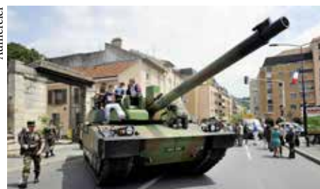
Un char Leclerc rue Gallieni !