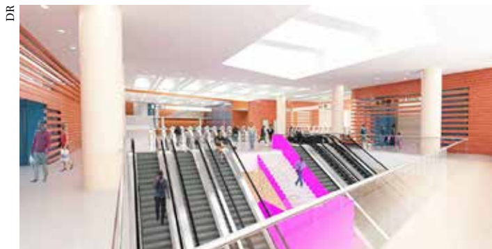
Vue du puits de circulation verticale (vue de synthèse en cours d'étude – susceptible d'être modifiée).

Le projet de la ligne 15 est un exemple de concertation. Des réunions publiques et des ateliers ont été organisés. Le comité d'animation du quartier Ouest-Nord a ainsi réalisé un cahier de préconisations, porté à la connaissance de la SGP. La concertation va se poursuivre avec la mise en place de comités de suivi rassemblant tous les acteurs (SPG, collectivités, associations...). La SGP va également accompagner les riverains qui pourraient être impactés par le chantier, notamment en terme de nuisances sonores ou vibratoires qui devraient être mineures compte tenu de la profondeur de la ligne (25m). ■