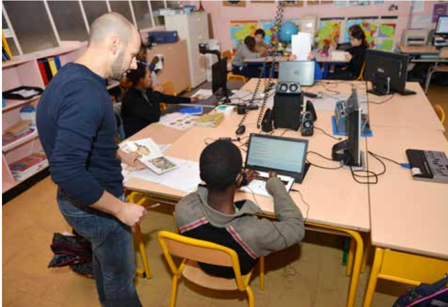
CLIS (classe pour l'inclusion scolaire) déficients visuels de l'école élémentaire Paul Doumer.