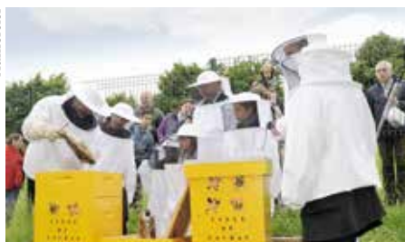
Inauguration des ruches au mois de mai