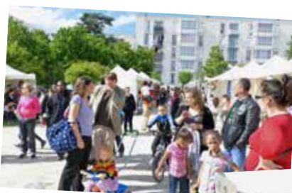
Fête des quartiers