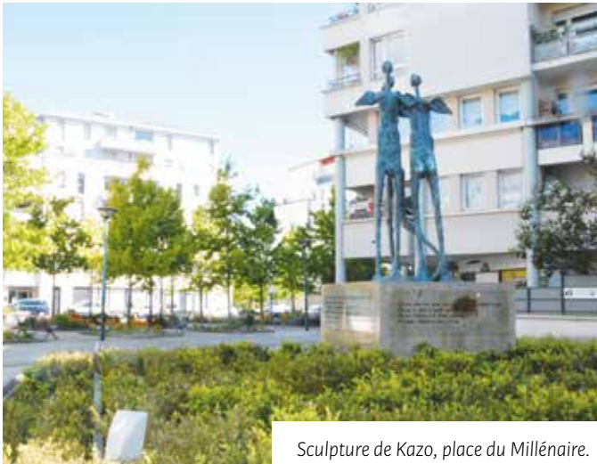
Sculpture de Kazo, place du Millénaire.