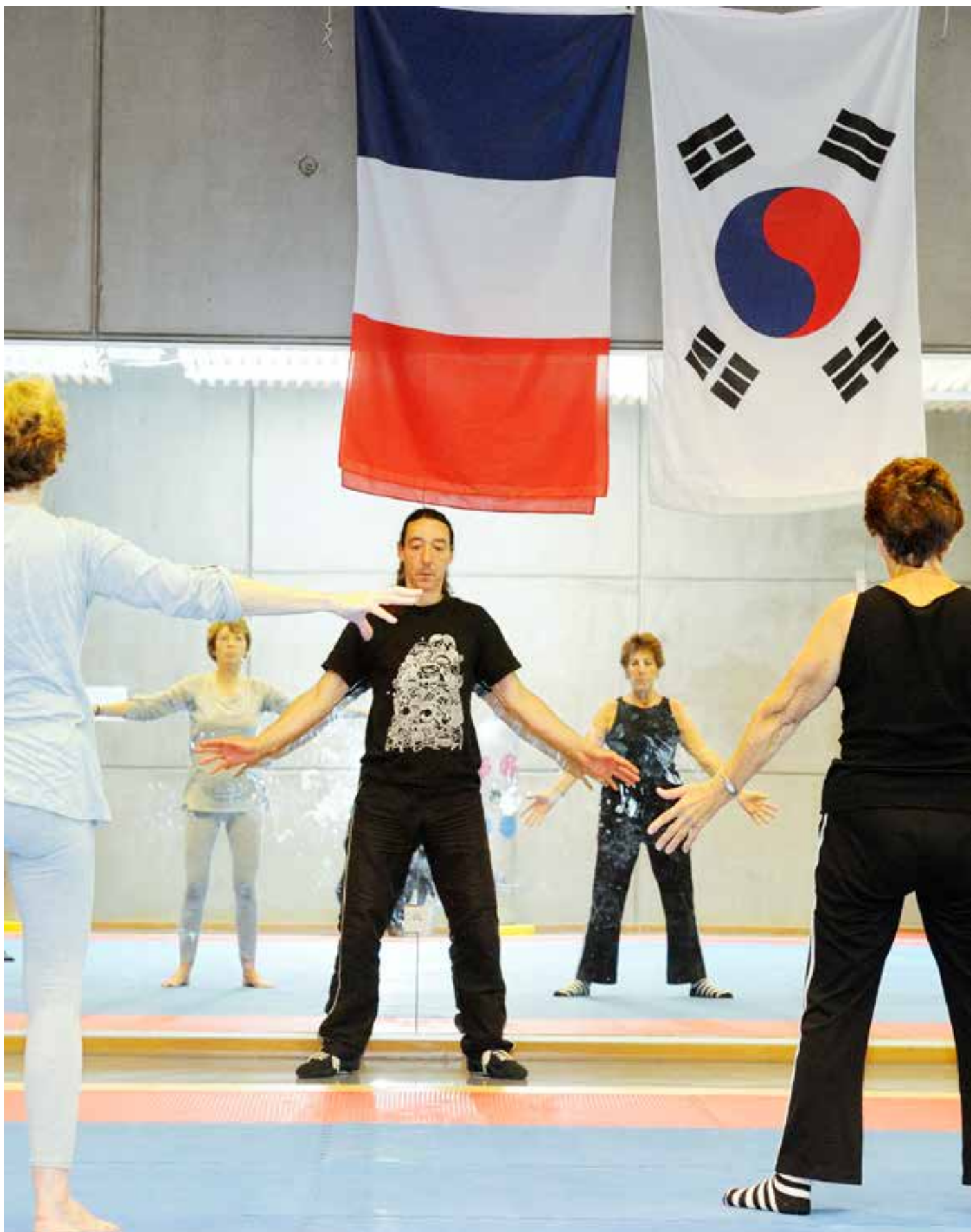
Aumercier Activités crok'sport de l'été pour les séniors