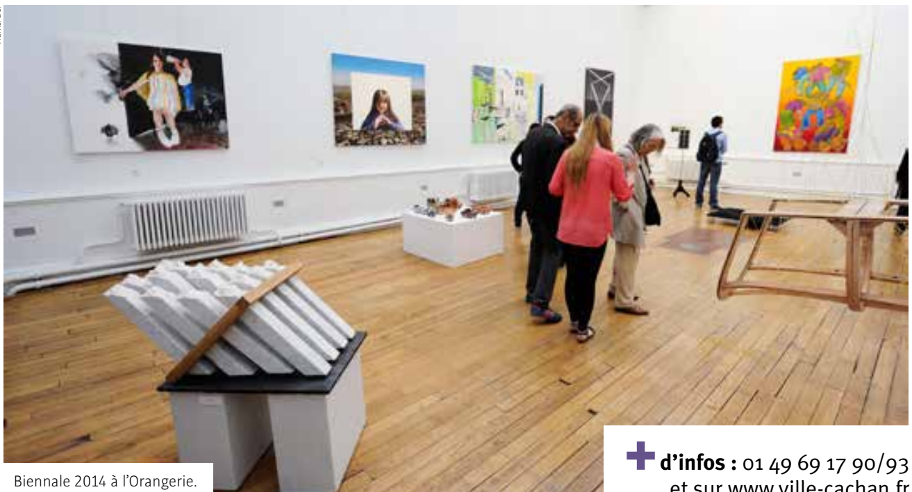
Biennale 2014 à l'Orangerie.

+ d'infos : 01 49 69 17 90/93 et sur www.ville-cachan.fr