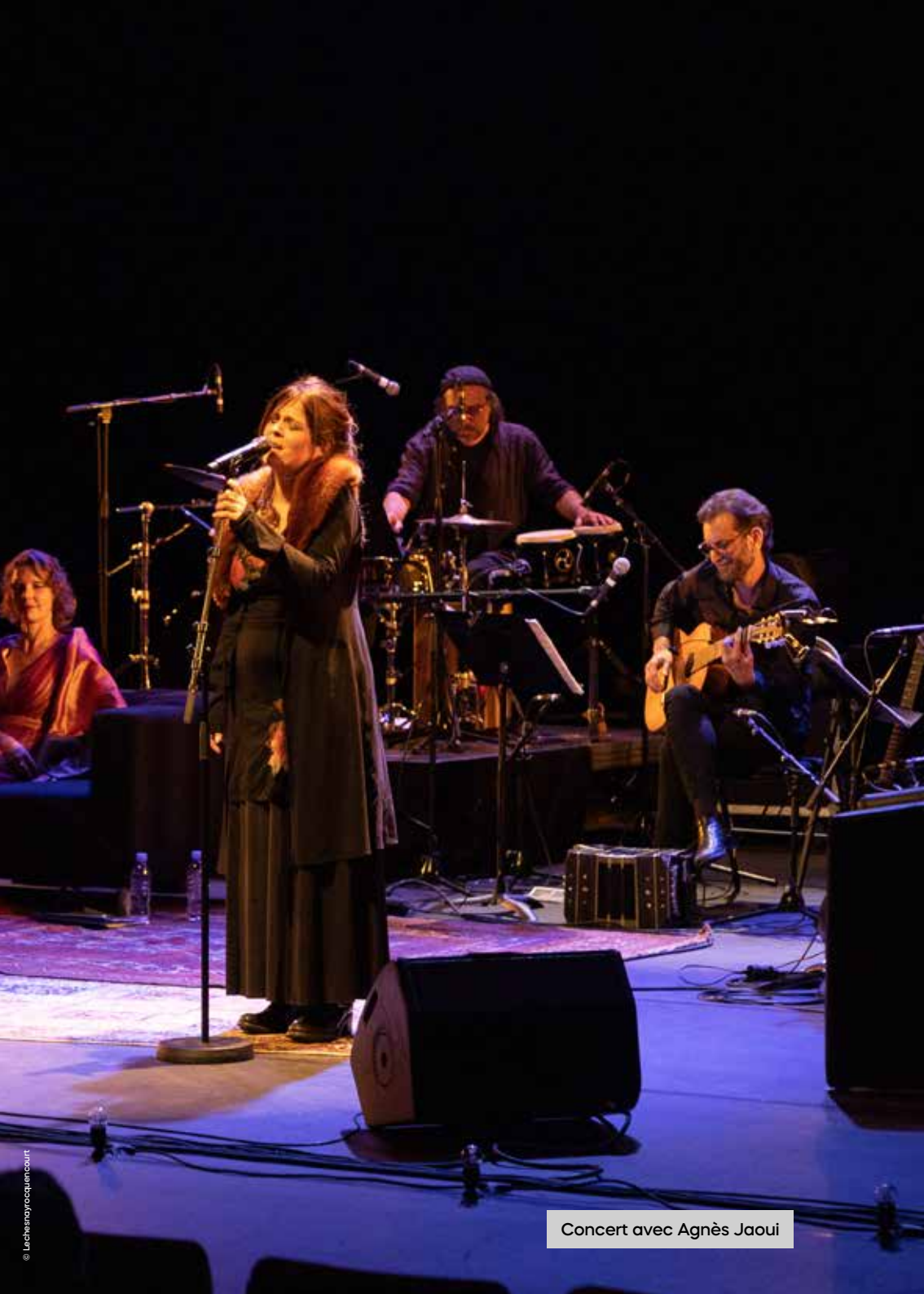
Concert avec Agnès Jaoui