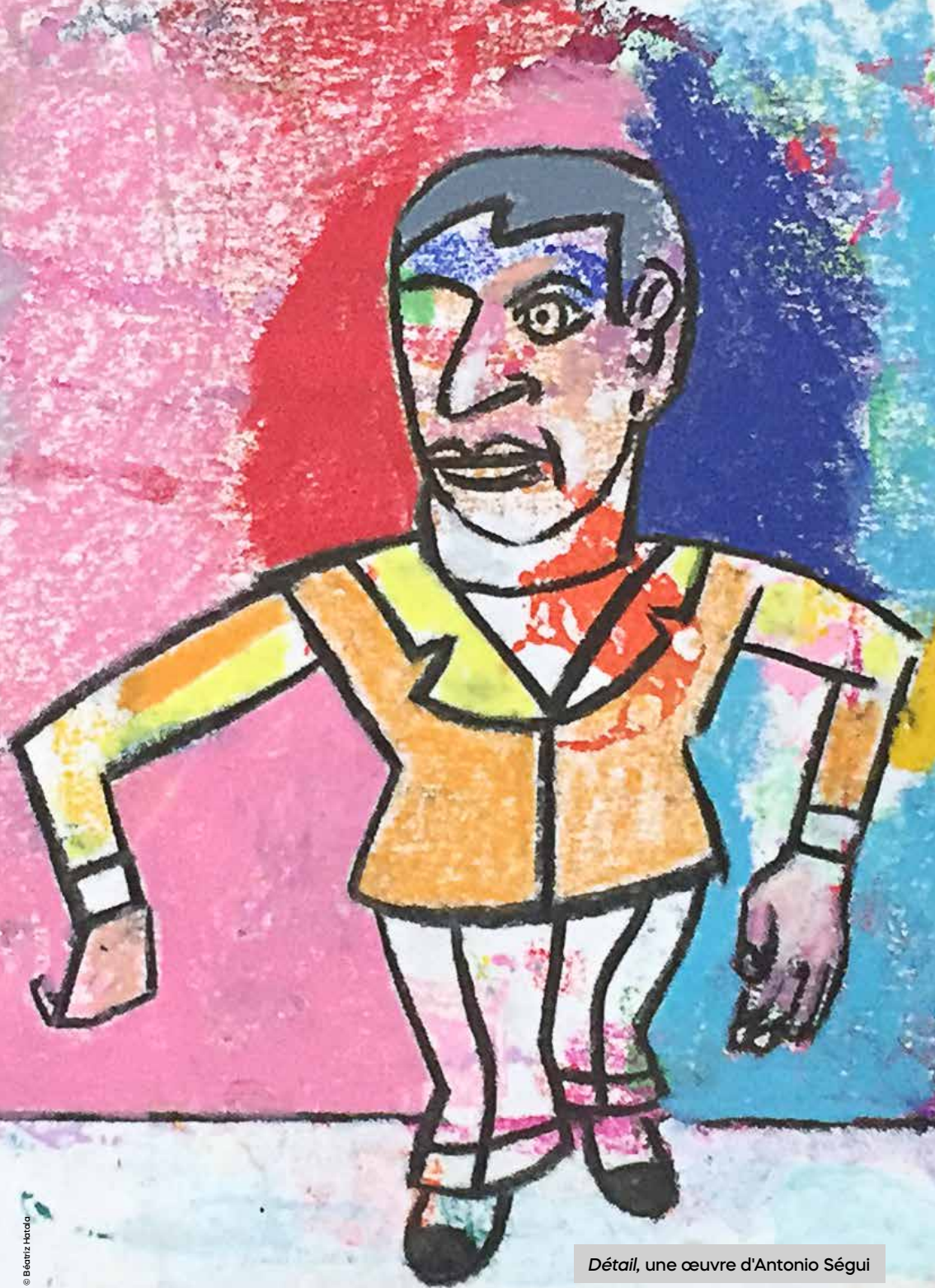
Détail, une œuvre d'Antonio Ségui