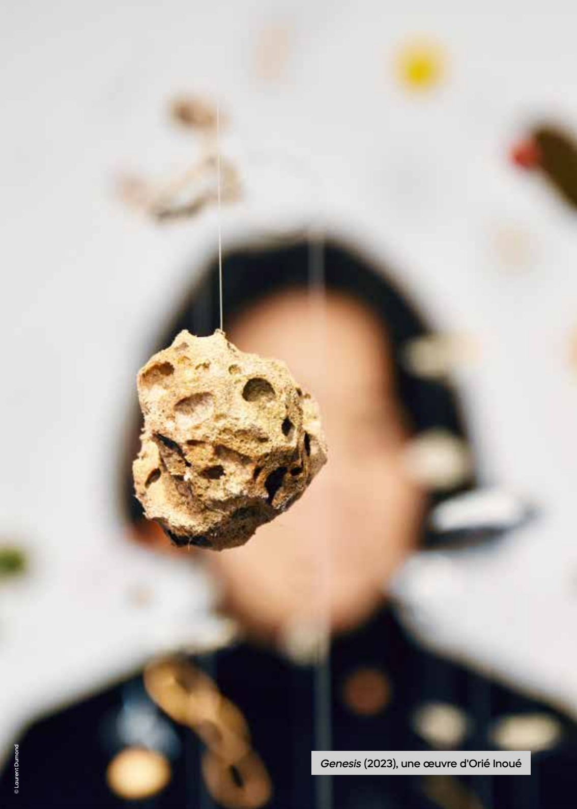
Genesis (2023), une œuvre d'Orié Inoué