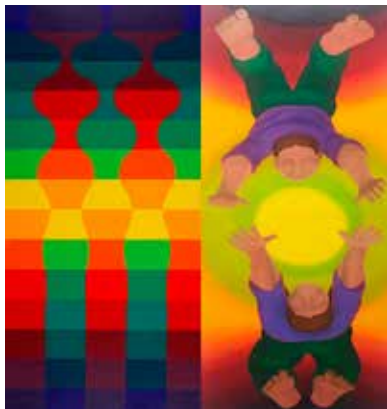
Le Parc Netto

Conçue par le service archives et patrimoine de la Ville, cette exposition est une invitation à la communion et à l'échange avec la nature, le tout sur un fond d'optimisme et d'ondes positives. Après les mois de confinement du printemps dernier, cette exposition est une manifestation sur le vivant avec pour objectif de retisser un lien naturel, culturel, social pour redonner le moral.