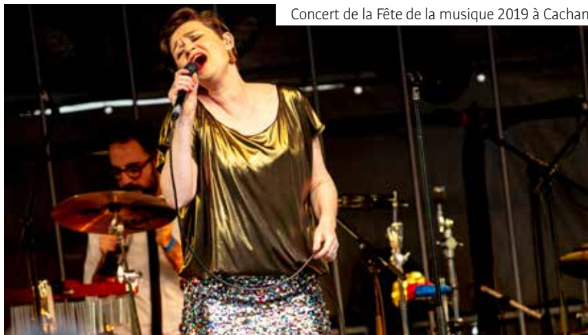
Concert de la Fête de la musique 2019 à Cachan.